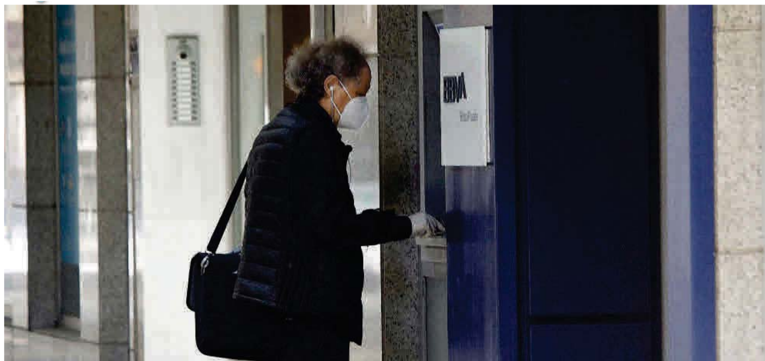
Un hombre con mascarilla saca dinero de un cajero automático.