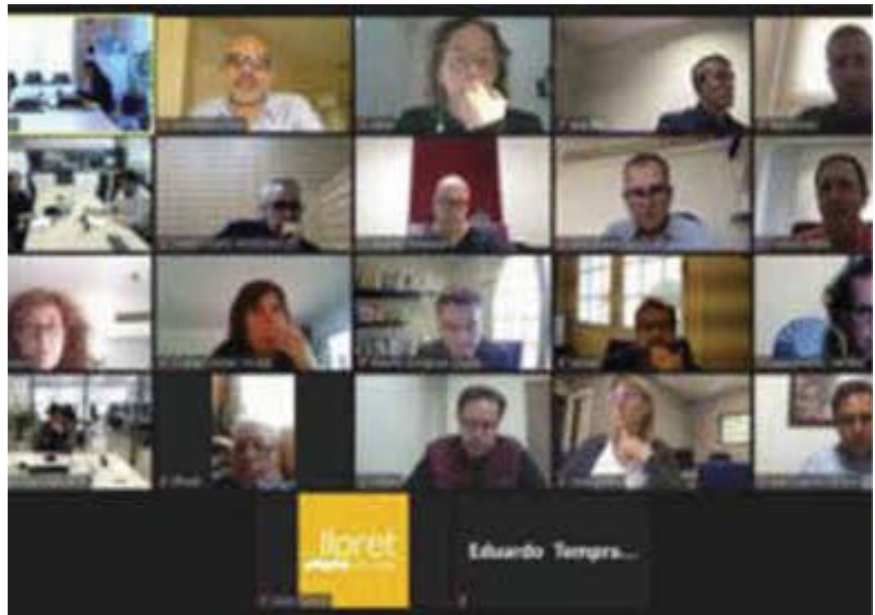
Taula turisme Lloret de Mar

La creació de la taula de turisme familiar de Lloret de Mar és la