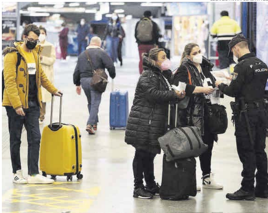
▶ Agentes de la Policía Nacional piden justificantes, este viernes, en Atocha.

Fuentes de Renfe reconocen que la oferta de billetes se ha situado para la Semana Santa en torno al 50% de la existente en las mismas fechas del 2019, con una demanda media de solo el 30% (y más ocupación en días laborables). En el caso de los vuelos, las principales aerolíneas anunciaron un incremento de su oferta para estos días. Hay programados para este periodo (entre el 26 de marzo y el 5 de abril) 18.100 vuelos de ida y vuelta