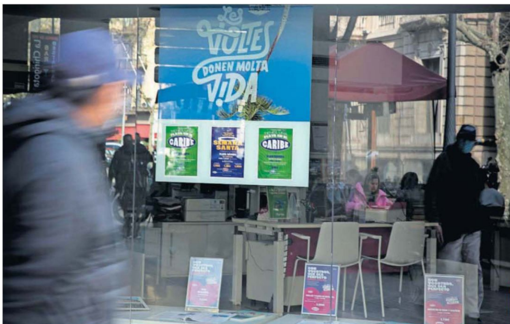
Una oficina de la agencia de viajes Nautalia en la calle Mallorca de Barcelona, el pasado jueves.