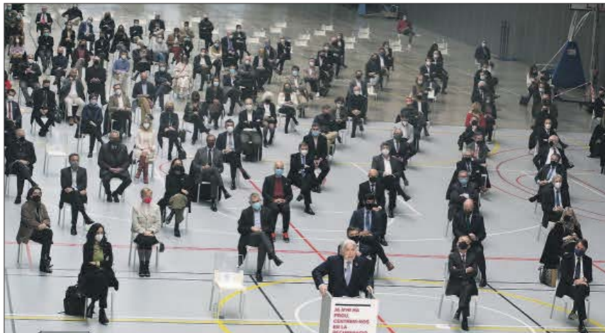
Unos 300 representantes de entidades y empresas se dieron cita en la Estación del Norte de Barcelona. LUIS MORENO

Por lo que respecta al papel de las administraciones, instó a que gobiernen con la prioridad de “le-