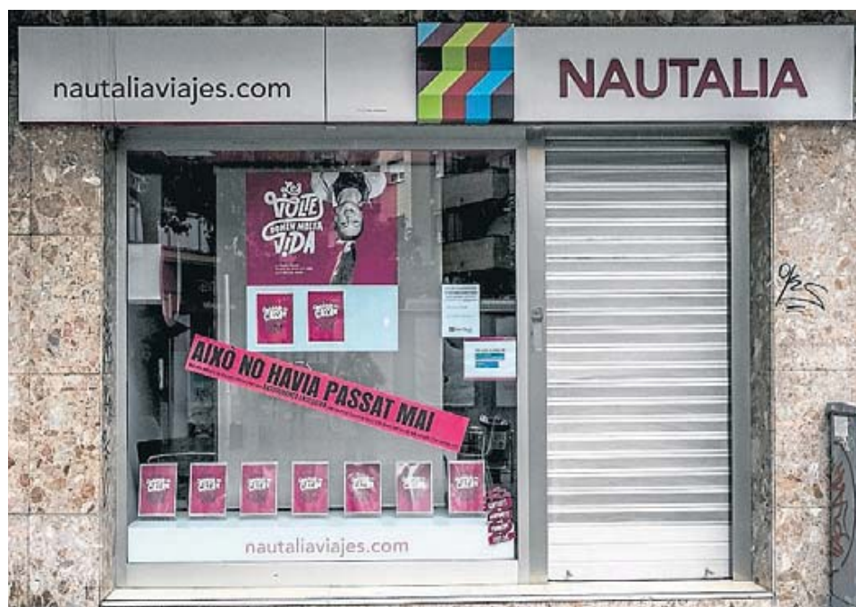
Imatge d'una agència de viatges a Cornellà de Llobregat amb la persiana abaixada durant la pandèmia. XAVIER BERTRAL