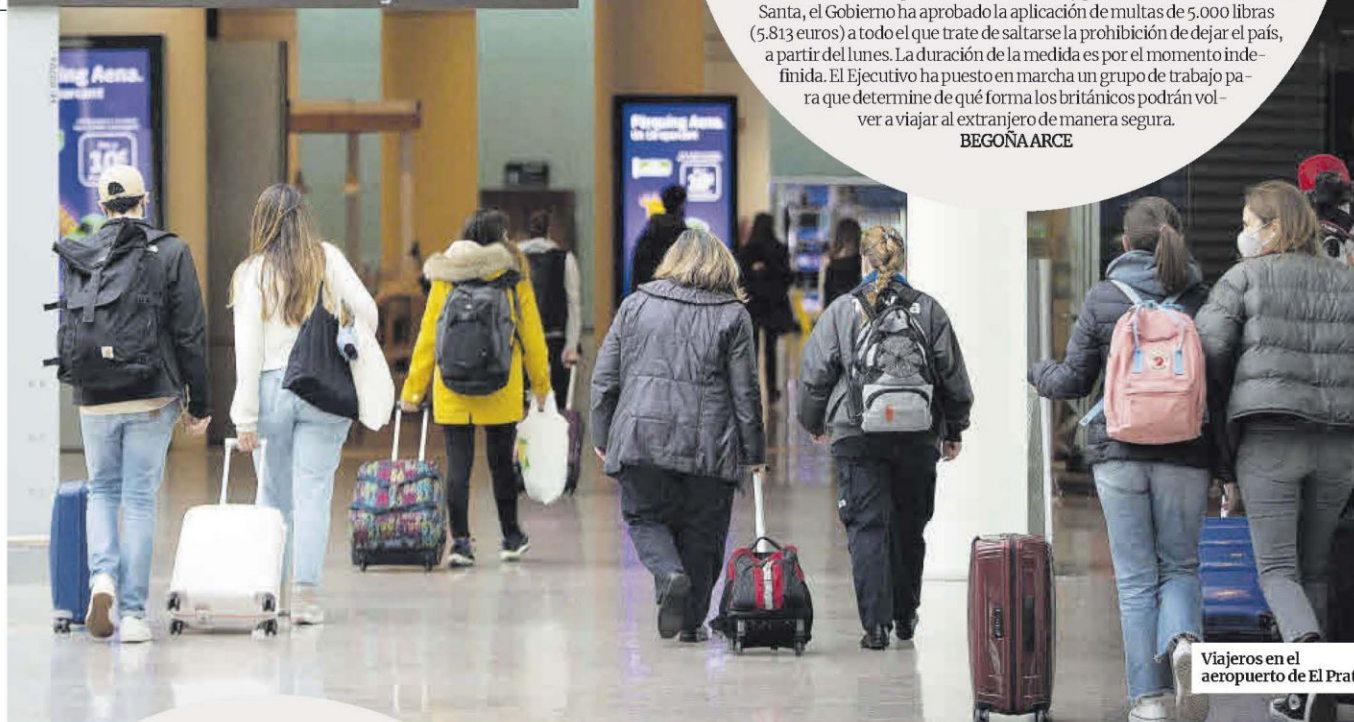
Viajeros en el aeropuerto de El Prat.