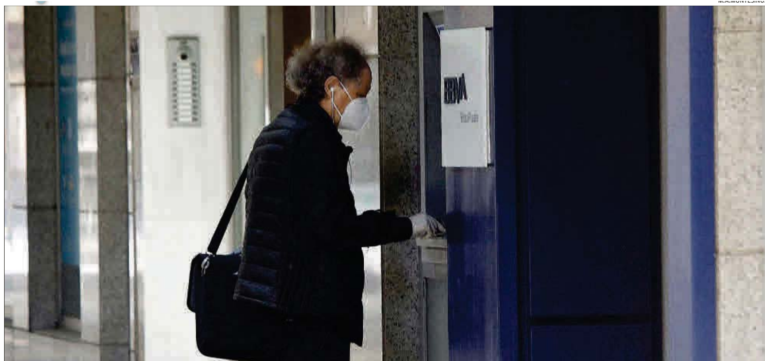
Un hombre con mascarilla saca dinero de un cajero automático.