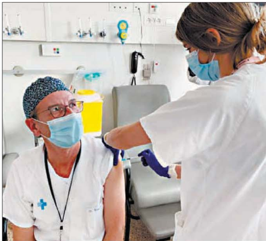
El col·lectiu dels professionals de la salut va ser dels primers a vacunar-se a començaments d'any

Aquest augment en les vacunacions, unit a les altes temperatures, proporcionaran "un esce-