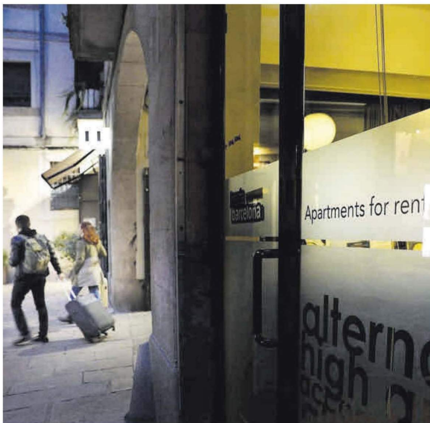
Dos turistas pasan con maletas por delante de una agencia de pisos turísticos en el Born.

En cambio, la Generalitat trabajó con la retirada en genérico. Ambos procesos perseguían lo mismo, pero la vía elegida por el consistorio queda excluida de los efectos de la nueva sentencia, según definen los servicios jurídicos municipales. De hecho, fuentes de la Direcció General de Turisme indica-