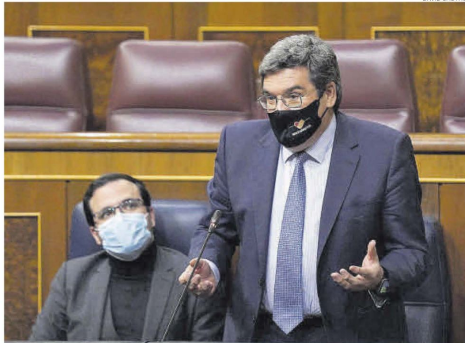
El ministro Jose Luis Escrivá durante la sesión de control al Gobierno en el Congreso, el pasado miércoles.

FASE MÁS ESTABLE # El próximo 28 de febrero vencen las ayudas excepcionales habilitadas por el Gobierno para que las empresas afectadas por alguna de las derivadas del covid se adhieran a un expediente. Estas fueron implementadas en marzo del 2020, al calor del primer estado de alarma, y han sido renovadas trimestre tras trimestre durante los últimos dos años. En su pico máximo, 3,4 millones de trabajadores llegaron a estar afectados por un erte. Hasta este 28 de febrero, pues el Gobierno considera que la economía debe entrar en una fase más estable y que las empresas deben ajustar sus plantillas si lo necesitaran mediante los nuevos mecanismos