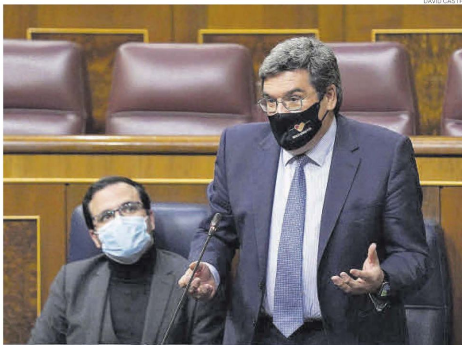
El ministro Jose Luis Escrivá durante la sesión de control al Gobierno en el Congreso, el pasado miércoles.

FASE MÁS ESTABLE # El próximo 28 de febrero vencen las ayudas excepcionales habilitadas por el Gobierno para que las empresas afectadas por alguna de las derivadas del covid se adhieran a un expediente. Estas fueron implementadas en marzo del 2020, al calor del primer estado de alarma, y han sido renovadas trimestre tras trimestre durante los últimos dos años. En su pico máximo, 3,4 millones de trabajadores llegaron a estar afectados por un erte. Hasta este 28 de febrero, pues el Gobierno considera que la economía debe entrar en una fase más estable y que las empresas deben ajustar sus plantillas si lo necesitaran mediante los nuevos mecanismos