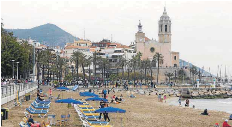
Sitges, una de les destinacions turístiques més conegudes, en una imatge d'arxiu

Desestacionalitzar i incentivar el turisme prop de casa abaratint-ne l'estada amb una bonificació. El conseller d'Empresa i Treball, Roger Torrent, va presentar ahir des de la Casa Vicens la campanya L'estalviatge , promoguda pel govern i que consisteix a bonificar la meitat del cost de cada reserva turística, amb un topall de 150 euros, que es faci al territori entre els mesos de març i abril, a excepció de la Setmana Santa. Les contractacions s'hauran de validar a través de les agències de viatges que s'hagin adherit a la iniciativa, que té un pressupost tancat d'1,5 milions d'euros i que es preveu que pugui donar cobertura a unes 10.000 reserves. Per poder accedir a l'abonament, la reserva haurà d'incloure com a mínim una pernoctació en un allotjament turístic català i que aquesta estigui associada amb almenys algun servei complementari,