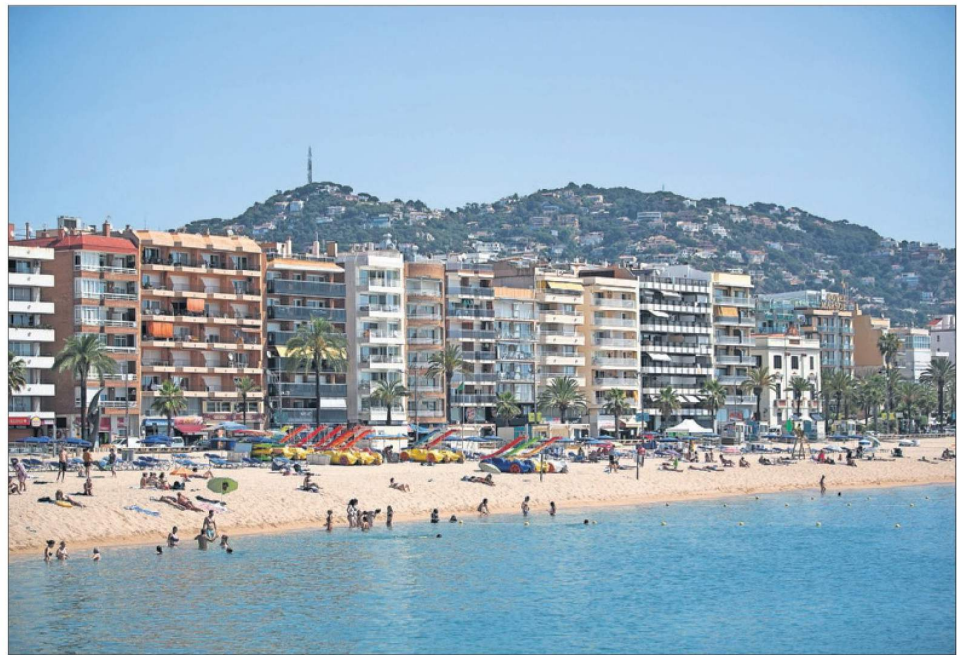
La playa de Lloret de Mar, uno de los principales destinos turísticos de rusos y ucranianos en Cataluña, el 15 de junio de 2021.