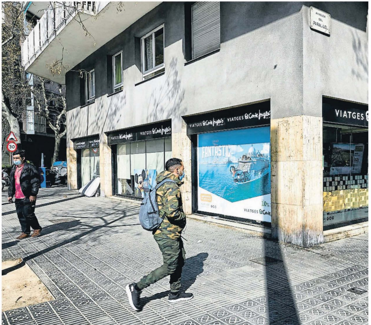
Los tres grandes grupos de agencias de viajes están negociando ajustes que afectarán a 8.600 trabajadores

El ministro de Inclusión y Seguridad Social, José Luis Escrivá, ya adelantó ayer por la mañana la intención del Gobierno de dar protección a las agencias de viaje con este mecanismo RED. Indicó que cuando un sector concreto necesite reestructurarse "porque no