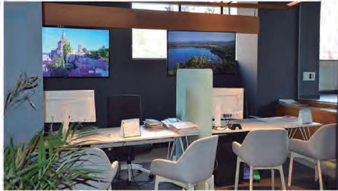
Un 23% de los trabajadores del sector todavía están afectados por una reducción.