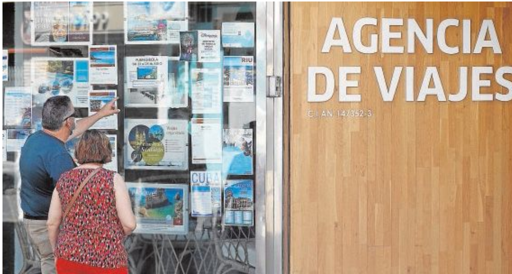
Una agencia de viajes en Córdoba