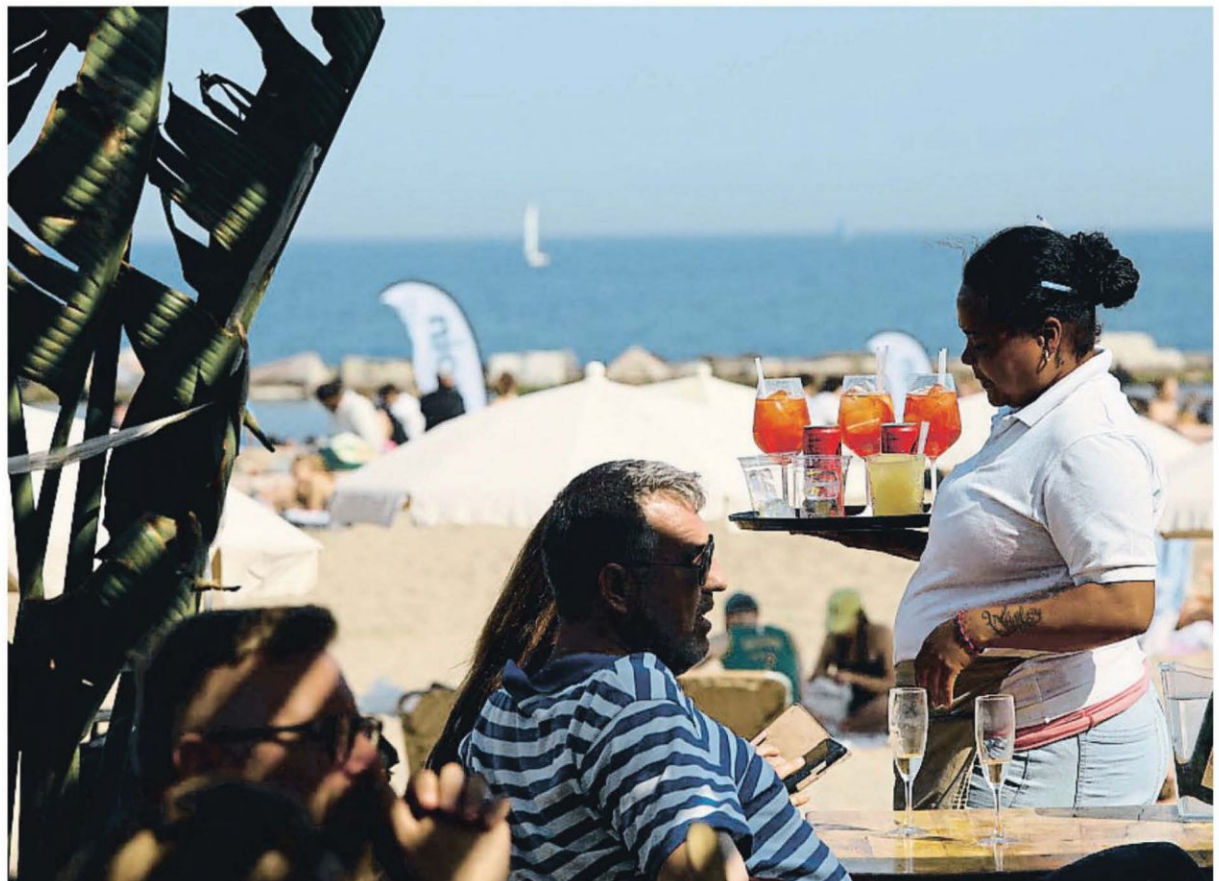
Una trabajadora del sector de la hostelería y el turismo en Barcelona

abogado de Ortega Condomines. En el caso de las camareras de piso –las kellys–, uno de los eslabones más débiles y precarizados de la cadena turística, se han de aplicar durante estos días importantes novedades: la prevalencia del