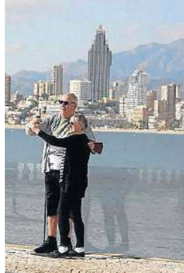
Una pareja en Benidorm.

Un dato destacable es que el 68% de las agencias coincide en que la mayoría de reservas se efectuaron con entre uno y tres meses de antelación, en gran parte para aprovechar ofertas o para evitar un encarecimiento. Otro 25% afirma que sus clientes han