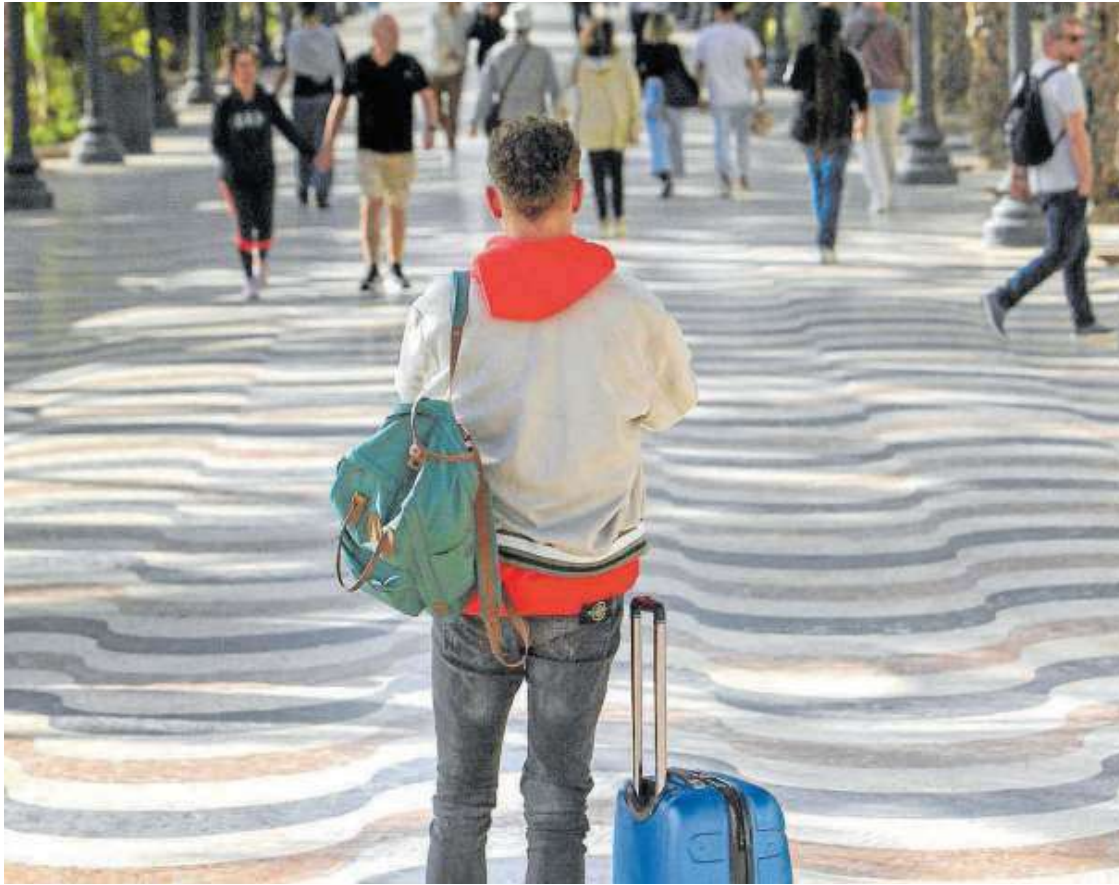
Un turista, en un paseo de Alicante en el día en que entró en vigor el registro obligatorio de viajeros.