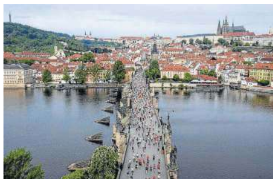
Praga es una de las ciudades más visitadas de Europa.

Este interés llega en un momento en el que crece también el empleo en el sector. Así, en noviembre, los afiliados en actividades turísticas aumentaron en términos absolutos en 134.650 personas, alcanzando una cifra total superior a los 2,72 millones de trabajadores. Esto supone un incremento del 5,2% respecto al mismo mes del año anterior. En noviembre la cifra de asalariados en el sector turístico, que representa el 81,6% del total de trabajadores afiliados en dicho sector, aumentó un 6,1% respecto al mismo mes del año anterior. Por ramas de actividad, el empleo asalariado se incrementó en agencias de viajes y operadores turísticos (5,7%) y en hostelería (5,7%), y dentro de ésta, aumentó un 8,6% en los servicios de alojamiento y un 4,9% en los servicios de comidas y bebidas. -E.P.