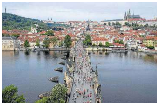
Praga es una de las ciudades más visitadas de Europa.

Este interés llega en un momento en el que crece también el empleo en el sector. Así, en noviembre, los afiliados en actividades turísticas aumentaron en términos absolutos en 134.650 personas, alcanzando una cifra total superior a los 2,72 millones de trabajadores. Esto supone un incremento del 5,2% respecto al mismo mes del año anterior. En noviembre la cifra de asalariados en el sector turístico, que representa el 81,6% del total de trabajadores afiliados en dicho sector, aumentó un 6,1% respecto al mismo mes del año anterior. Por ramas de actividad, el empleo asalariado se incrementó en agencias de viajes y operadores turísticos (5,7%) y en hostelería (5,7%), y dentro de ésta, aumentó un 8,6% en los servicios de alojamiento y un 4,9% en los servicios de comidas y bebidas. – E.P.