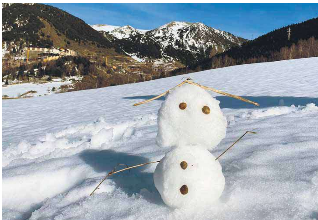
Milers de persones aniran al Pirineu pel pont de la Puríssima per esquiar i fer activitats al voltant de la neu