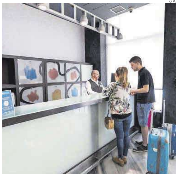
Una pareja de turistas hace el 'check-in' en un hotel.