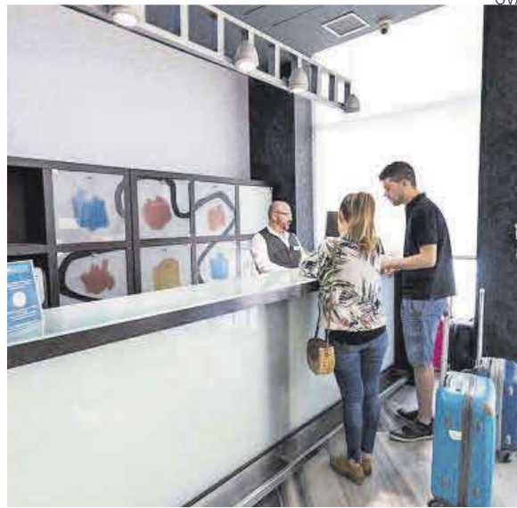
Una pareja de turistas hace el 'check-in' en un hotel.