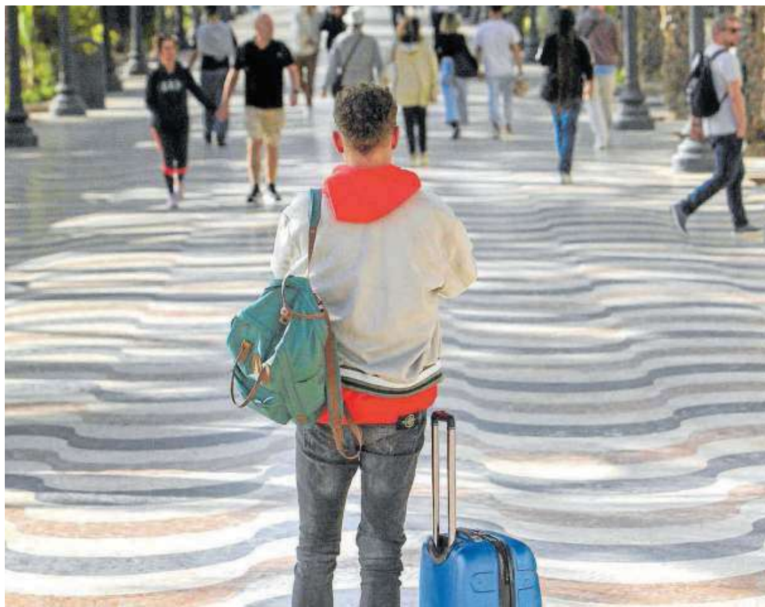
Un turista en un paseo de Alicante, en el día en que entró en vigor el registro obligatorio de viajeros.