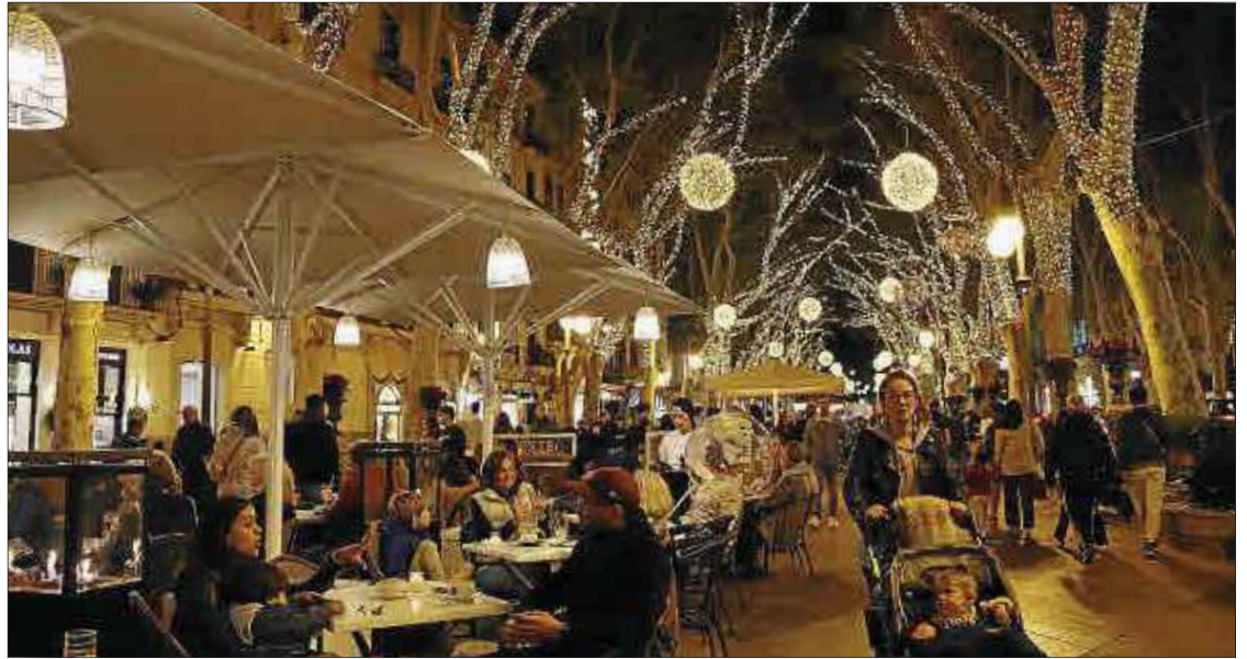
La temporada navideña en Palma es un aliciente destacado para la actividad turística.

Por su parte, el presidente de la patronal balear Aviba, Pedro Fiol, especifica que, según una encuesta interna entre las agencias de viajes asociadas, el 80 % de las mismas prevé unas navidades con cifras iguales o superiores a las del año pasado. Fiol