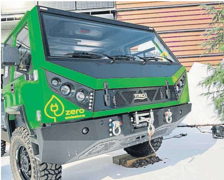
La apuesta de este año es la sostenibilidad; La Molina estrena a Torgo, 4x4 totalmente eléctrico

do estos días las agencias de viaje, que apenas han notado diferencias con una semana de noviembre. Fuentes de la Asociación Corporativa de Agencias de Viajes Especializadas (Acave), que aglutina un millar de puntos de venta en España, reconocen que la actividad ha sido "mínima" y que la gente se reserva para Navidad y Fin de Año, cuando el calendario será más favorable. "Este año es un puente un poco desangelado, poco apto para viajes largos", explican desde la Acave. / Sílvia Oller