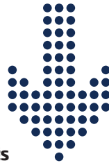
ELS QUE BAIXEN MÉS