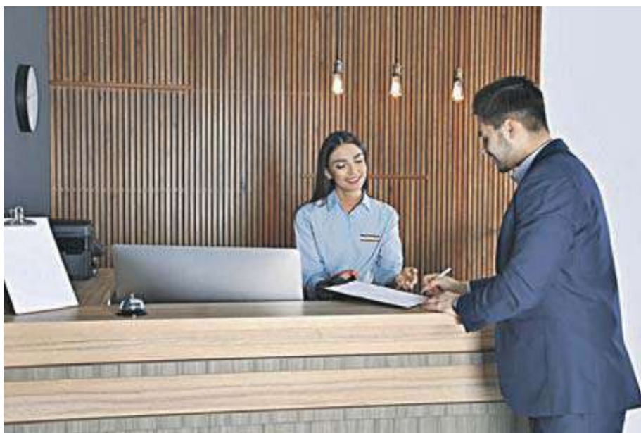
Un cliente se registra en la recepción de un hotel.

A estas críticas se suman las de los hoteleros, ya que la Confederación Española de Hoteles y Alojamientos Turísticos (Cehat) denunció que el nuevo reglamento no sólo afecta negativamente a los turistas internacionales, sino también a los ciudadanos españoles que hacen uso de hoteles y alojamientos en sus desplazamientos dentro del país. “Estos deberán en-