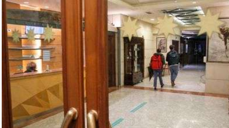
Imagen de archivo de la recepción del hotel Suizo. JOSE PARDO

Agencias de viajes se quejan de que la plataforma donde hay que introducir la información se ha caído, impidiendo registrar las operaciones: «Sabíamos que el primer día iba a ser un caos»