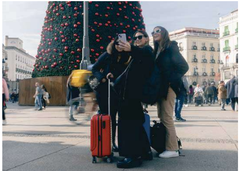
Un grupo de turistas se hacen fotos junto al árbol de Navidad de la Puerta del Sol de Madrid.

Los datos que deben dar de los clientes son nombre y apellidos, sexo, DNI, nacionalidad, fecha de nacimiento, lugar de residencia habitual, teléfonos, correo electrónico, número de viajeros y relación de parentesco (en el caso de que alguno sea menor de