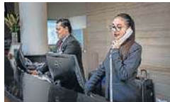
Recepción en un hotel en una imagen de archivo.

En concreto, entre las denuncias más pronunciadas por la industria están su posible incompatibilidad con el reglamento de la Unión Europea, unido a que su aprobación generaría "inseguridad jurídica e imposibilidad de cumplimiento", desventaja competitiva en el mercado nacional y europeo, falta de adecuación tecnológica y carga administrativa despropor-