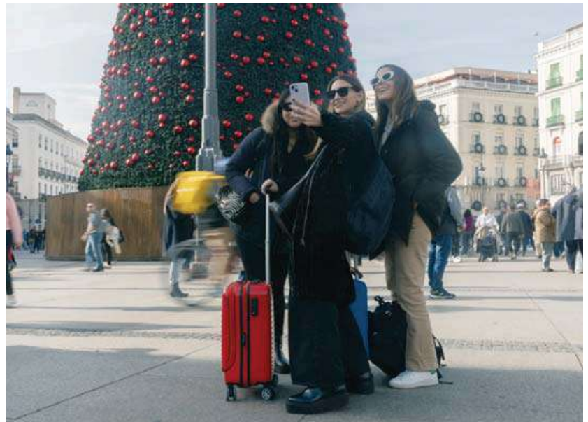
Un grupo de turistas se hacen fotos junto al árbol de Navidad de la Puerta del Sol de Madrid.

Los datos que deben dar de los clientes son nombre y apellidos, sexo, DNI, nacionalidad, fecha de nacimiento, lugar de residencia habitual, teléfonos, correo electrónico, número de viajeros y relación de parentesco (en el caso de que alguno sea menor de