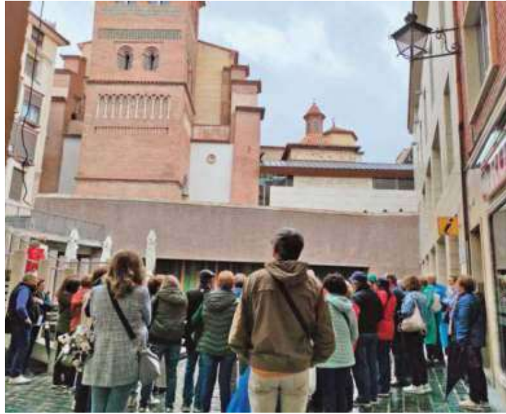
Turistas junto al Mausoleo de los Amantes en Teruel

Deben aportar información los hoteles, hostales, pensiones, casas de huéspedes, establecimientos de turismo rural, cámpines, zonas de estacionamiento de autocaravanas, apartamentos,