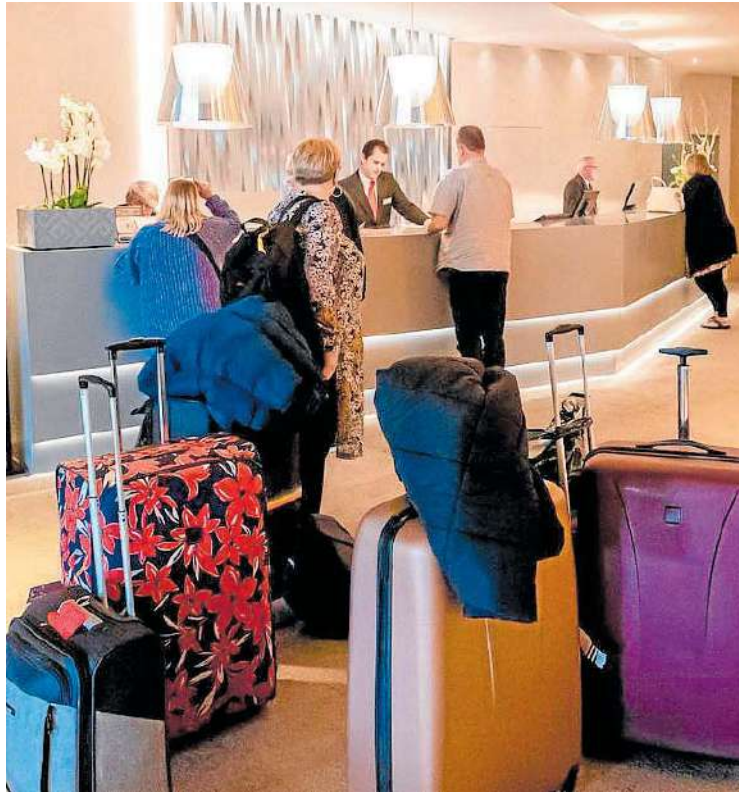
Recepción de un hotel

El sector turístico venía avisando en los últimos meses de que la plataforma no respondía en numerosas ocasiones y que esto podría suponer un problema para el trabajo diario una vez fuera de obligado cumplimiento el nuevo registro. Pero más allá de ello, el descontento del sector sigue vigente por el daño que dicen que provocará en su operativa, además de por suponer un riesgo