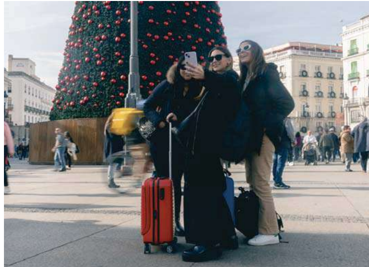
Un grupo de turistas se hacen fotos junto al árbol de Navidad de la Puerta del Sol de Madrid.

Los datos que deben dar de los clientes son nombre y apellidos, sexo, DNI, nacionalidad, fecha de nacimiento, lugar de residencia habitual, teléfonos, correo electrónico, número de viajeros y relación de parentesco (en el caso de que alguno sea menor de