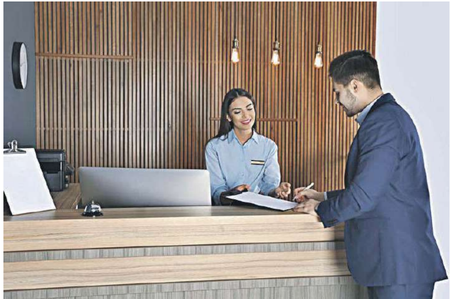
Un cliente se registra en la recepción de un hotel.

A estas críticas se suman las de los hoteleros, ya que la Confederación Española de Hoteles y Alojamientos Turísticos (Cehat) denunció que el nuevo reglamento no sólo afecta negativamente a los turistas internacionales, sino también a los ciudadanos españoles que hacen uso de hoteles y alojamientos en sus desplazamientos dentro del país. "Estos deberán en-