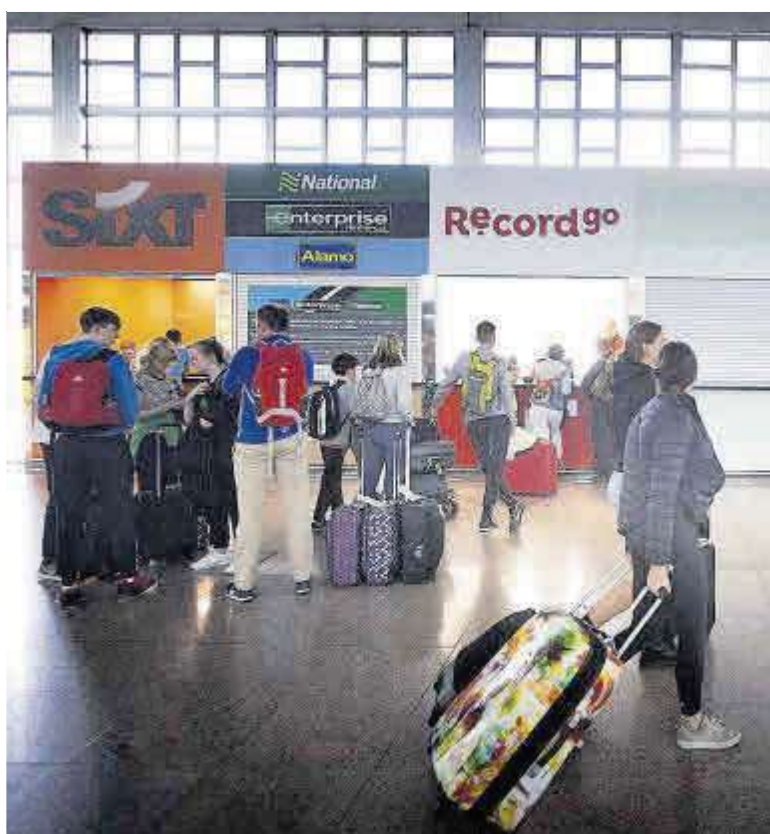
Empresas de alquiler de coches en el aeropuerto de El Prat.

«Después de dos años de preparativos, la semana pasada la Generalitat convocó al sector para comunicarnos que, como Catalunya tiene las competencias en seguridad transferidas, iba a abrir una nueva plataforma, distinta a la del ministerio, para comunicar los datos de las reservas correspondientes a alojamientos turísticos ubicados en esta comunidad», explicó un portavoz de la entidad. «Y el domingo, justo un día antes de la entrada en vigor del decreto, nos mandó un comunicado en que añadía una plataforma más, la tercera, referente a los coches de alquiler», agregó la misma fuente.