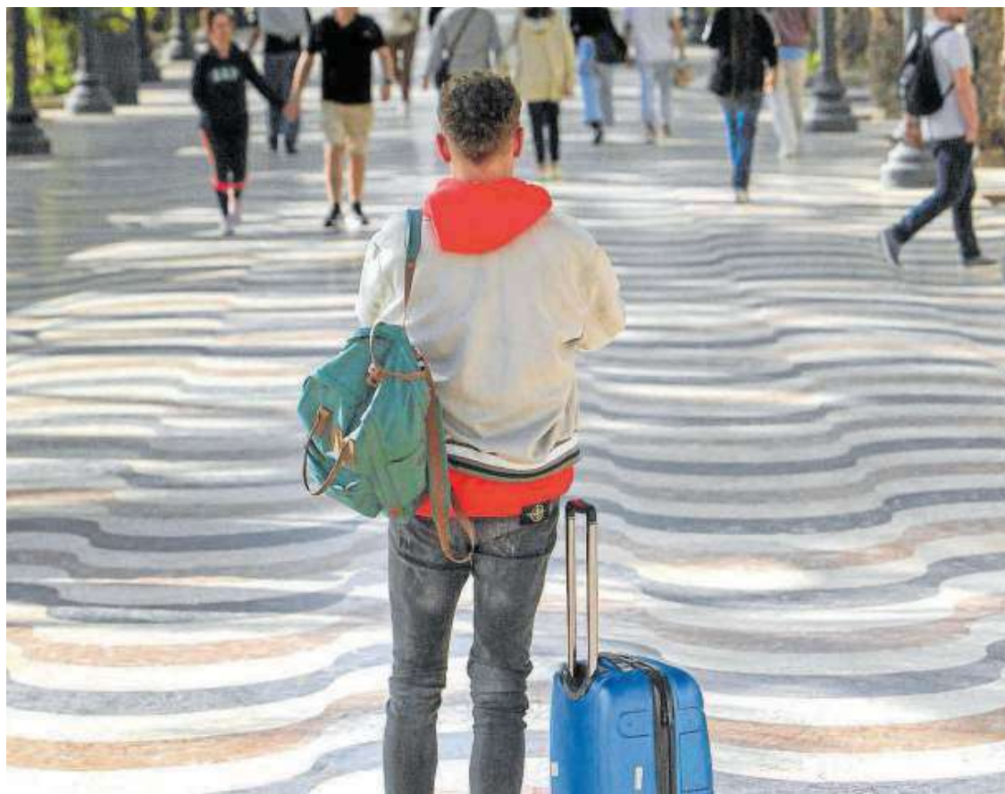
Un turista en un paseo de Alicante en el día en que entró en vigor el registro obligatorio de viajeros.