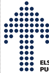
ELS QUE PUGEN MÉS