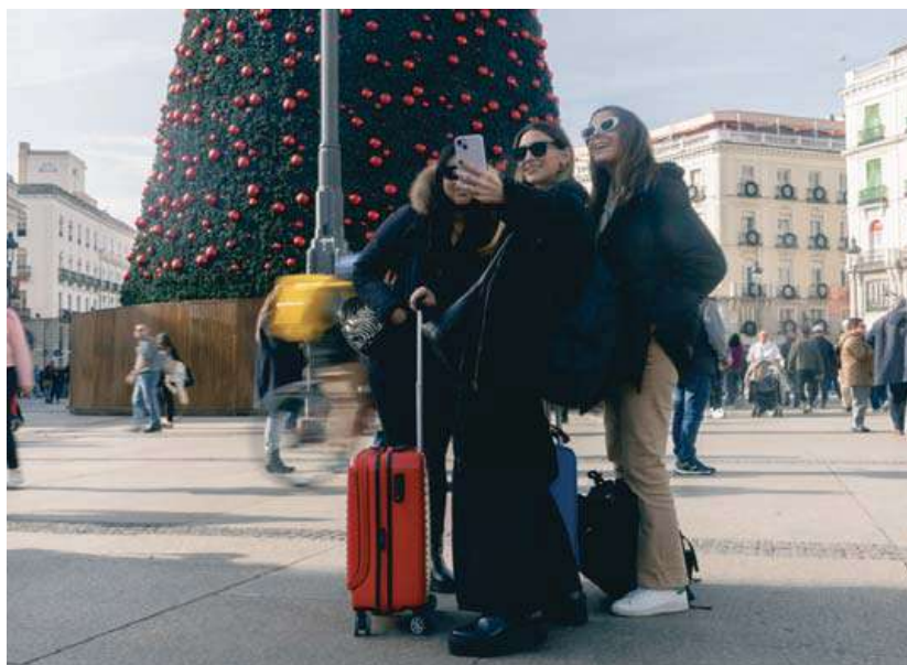
Un grupo de turistas se hacen fotos junto al árbol de Navidad de la Puerta del Sol de Madrid.

Los datos que deben dar de los clientes son nombre y apellidos, sexo, DNI, nacionalidad, fecha de nacimiento, lugar de residencia habitual, teléfonos, correo electrónico, número de viajeros y relación de parentesco (en el caso de que alguno sea menor de