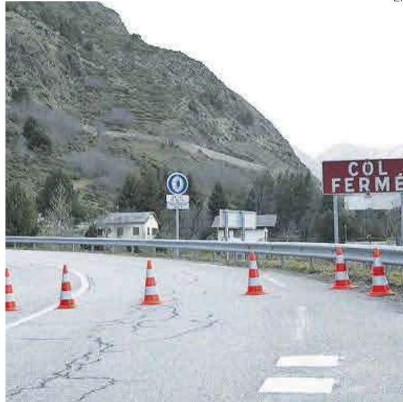
Lugar donde se accidentó el autocar cerca de Porté-Puymorens, ayer.

El viajero puede (y se le aconseja) estar informado de las cobertu-