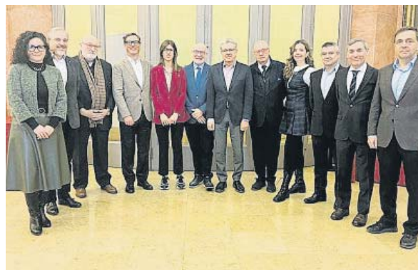
Los impulsores de Mou-te per Barcelona

Esta iniciativa surge en vísperas de que el Ayuntamiento de Barcelona presente hoy las líneas maestras del plan de movilidad urbana 2025-2030, que, como adelantó La Vanguardia el 29 de diciembre, se marca como objetivo que solo el 15% de los desplazamientos en la ciudad se efectúen en coche y moto, al tiempo que quiere incrementar los que se realizan en transporte público, bici y patinete eléctrico. ●