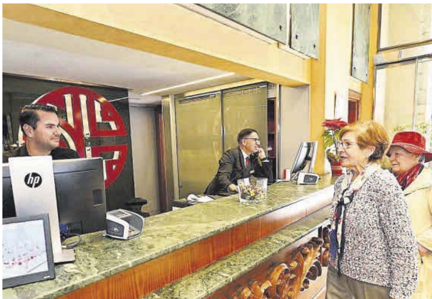
Dos turistas cumplimentan los datos del nuevo registro de viajeros en un hotel de Vigo.

Dentro de los firmantes también hay representación gallega: la Asociación Gallega de Agencias de