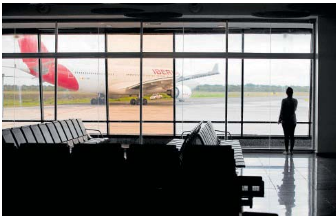
Avión de Iberia en el aeropuerto internacional de Las Américas, en Santo Domingo (República Dominicana)