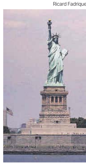
La Estatua de la Libertad.

Sí forman parte de los lugares preferidos a los que viajar, en cambio, los países emergentes de Asia