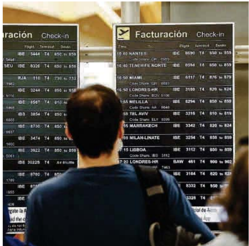
Turistas observan las pantallas de vuelos del Aeropuerto Adolfo Suárez .

Hace apenas tres meses, antes del verano, las principales ciudades de Estados Unidos, como Nueva York, Chicago, Las Vegas o San Francisco, y las rutas a los parques nacionales de ese país figuraban como uno de los cinco destinos favoritos de los españoles a la hora de planificar unas vacaciones. Este otoño, EE UU ha desaparecido de la lista, según ha informado este lunes la Asociación Corporativa de Agencias de Viajes Especializadas (Acave), que atribuye el cambio «a cuestiones de seguridad, a los controles de emigración que se aplican ahora y, en buena medida, a la antipatía que está generando entre los turistas, que no se sienten bienvenidos», ha afirmado Jordi Martí, presidente de la entidad. Sí forman parte de los lugares preferidos a los que viajar, en cambio, los países emergentes de Asia (China, Corea del Sur y la India) junto con Japón, América Latina, los safaris por África, las costas e islas mediterráneas y zonas de Próximo Oriente ajenas a la guerra, como Egipto, los Emiratos Árabes o Jordania. «De hecho, un 34,8% de las agencias asociadas a Acave han constatado un incremento en el número de viajes a China, India y Corea, que están convirtiéndose, cada vez más, en destinos muy atractivos